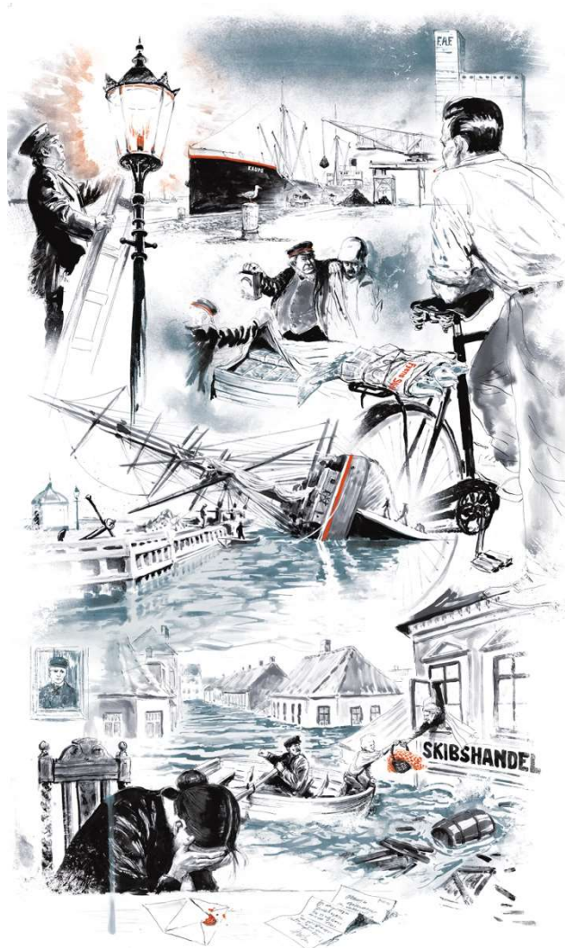
Havnen i Assens

Vi forventer, at DNA-projektet med beskrivelsen af nedslagspunkter i Assens bys udvikling fortsætter med 3-4 flere udgivelser af illustrationer om byens historie, således at hele projektet kan afsluttes med en samlet præsentation ved byjubilæet i 2024. Vores temaer for de kommende års udgivelser vil være Assens Kirkes historie, Købmandsgårdenes store betydning for byen, Industrialiseringen i Assens og Assens som handelsby og købstad.